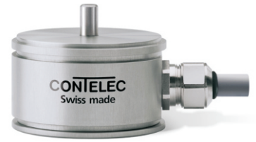
Vert-X 51 - 5V / SPI 订购代码